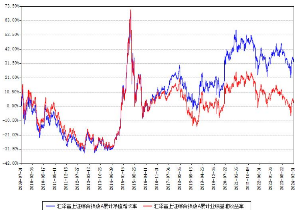
汇添富上证综合指数A累计净值增长率与同期业绩基准收益率对比图