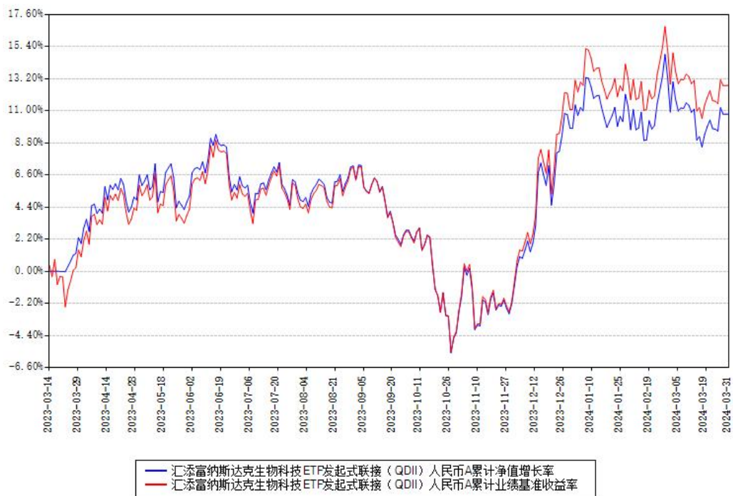
汇添富纳斯达克生物科技ETF发起式联接（QDII）人民币C累计净值增长率与同期业绩基准收益率对比图