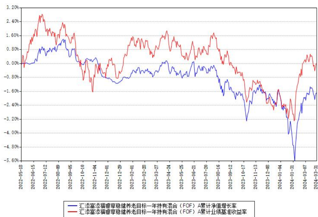
汇添富添福睿享稳健养老目标一年持有混合（FOF）A累计净值增长率与同期业绩比较基准收益率对比图