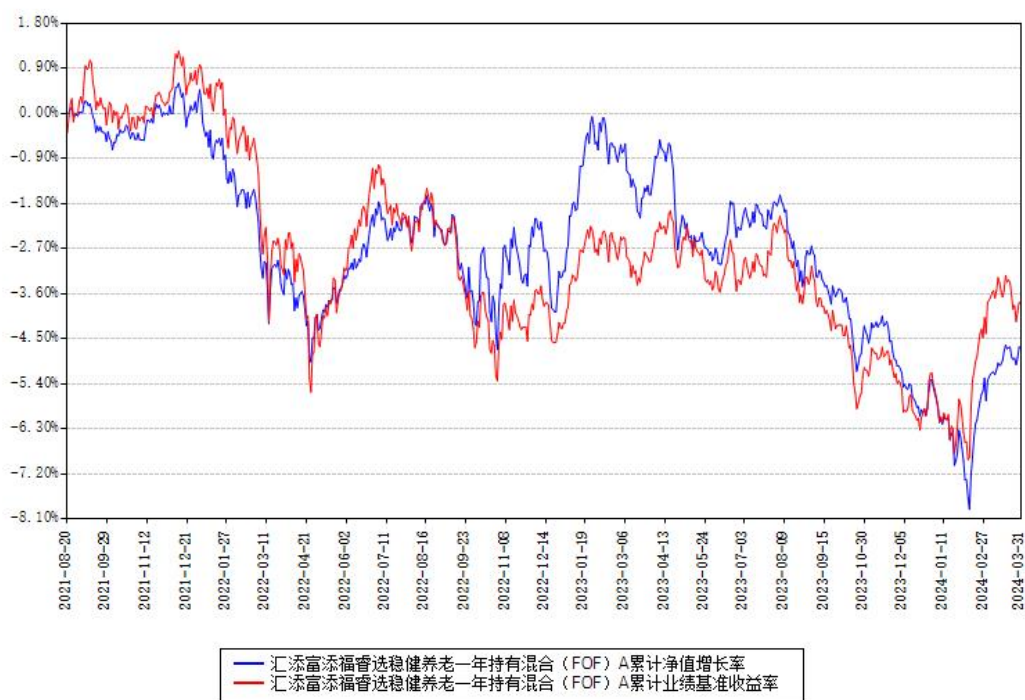
汇添富添福睿选稳健养老一年持有混合（FOF）A累计净值增长率与同期业绩比较基准收益率对比图