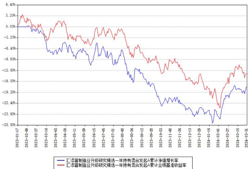
汇添富制造业升级研究精选一年持有混合发起C累计净值增长率与同期业绩基准收益率对比图