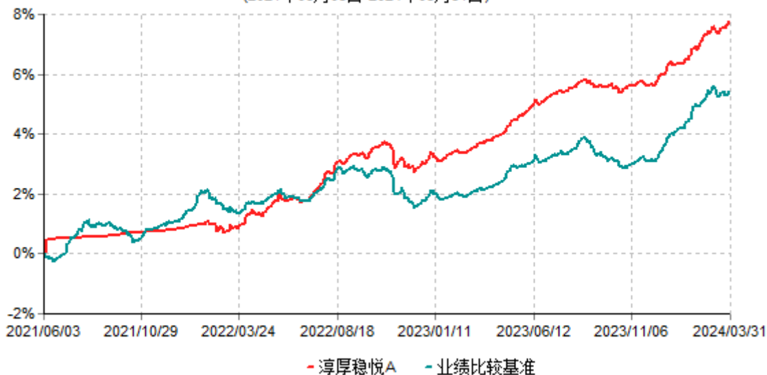
淳厚稳悦A累计净值增长率与业绩比较基准收益率历史走势对比图 (2021年06月03日-2024年03月31日)

注：本基金基金合同生效日为 2021 年 06 月 03 日。按基金合同规定，本基金自基金合同生效起 6 个月内为建仓期。建仓期结束时本基金的各项投资比例均符合基金合同约定。