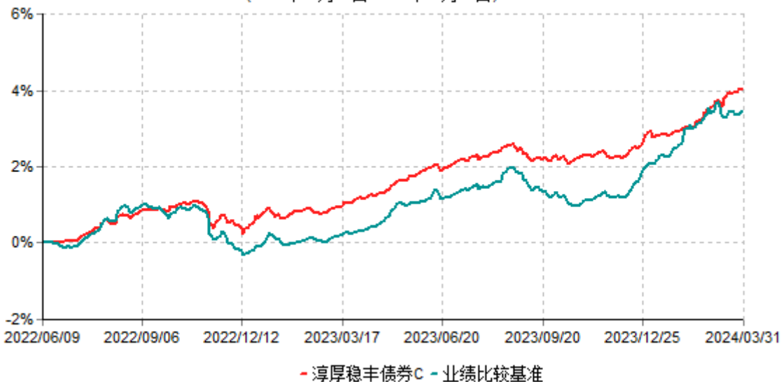
淳厚稳丰债券C累计净值增长率与业绩比较基准收益率历史走势对比图 (2022年06月09日-2024年03月31日)

注：本基金基金合同生效日为 2022 年 06 月 09 日。按基金合同规定，本基金自基金合同生效起 6 个月内为建仓期。建仓期结束时本基金的各项投资比例均符合基金合同约定。