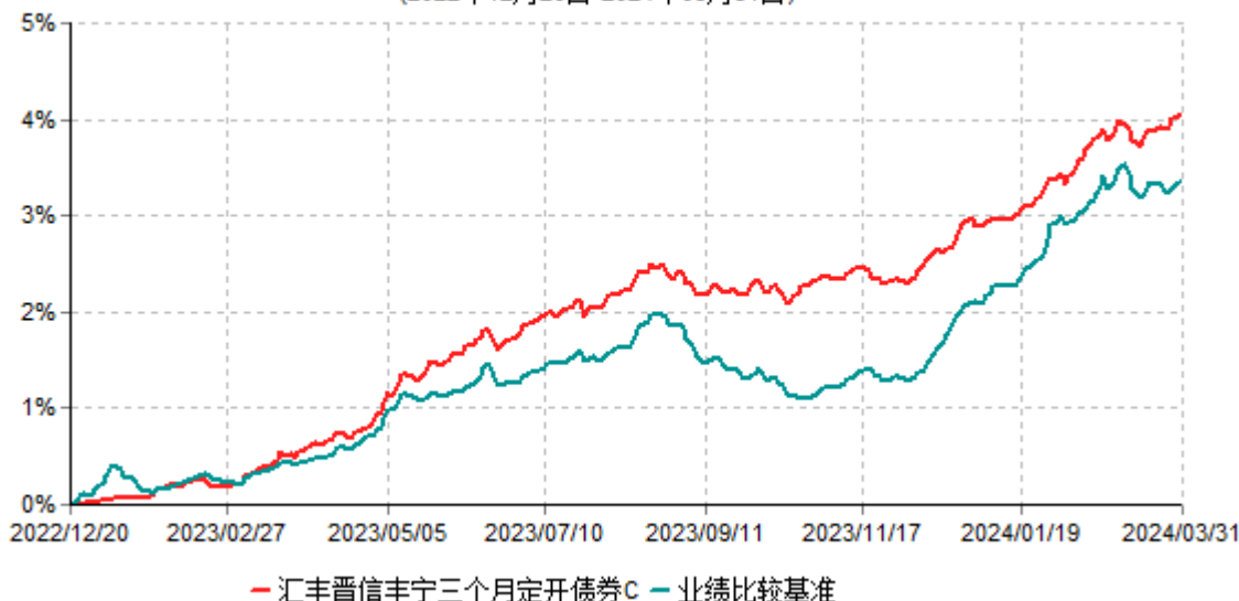
汇丰晋信丰宁三个月定开债券C累计净值增长率与业绩比较基准收益率历史走势对比图 (2022年12月20日-2024年03月31日)