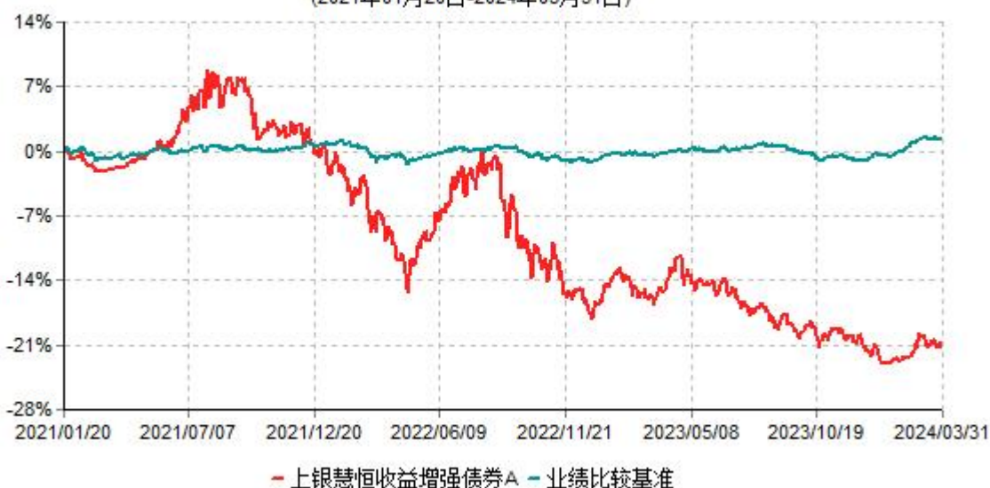
上银慧恒收益增强债券A累计净值增长率与业绩比较基准收益率历史走势对比图 (2021年01月20日-2024年03月31日)