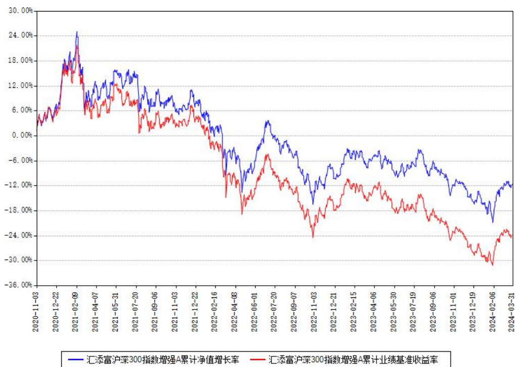
汇添富沪深300指数增强A累计净值增长率与同期业绩基准收益率对比图