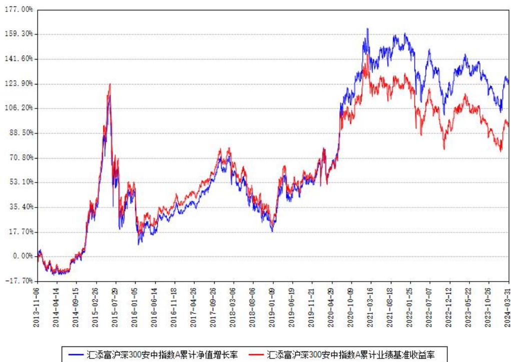
汇添富沪深300安中指数A累计净值增长率与同期业绩基准收益率对比图