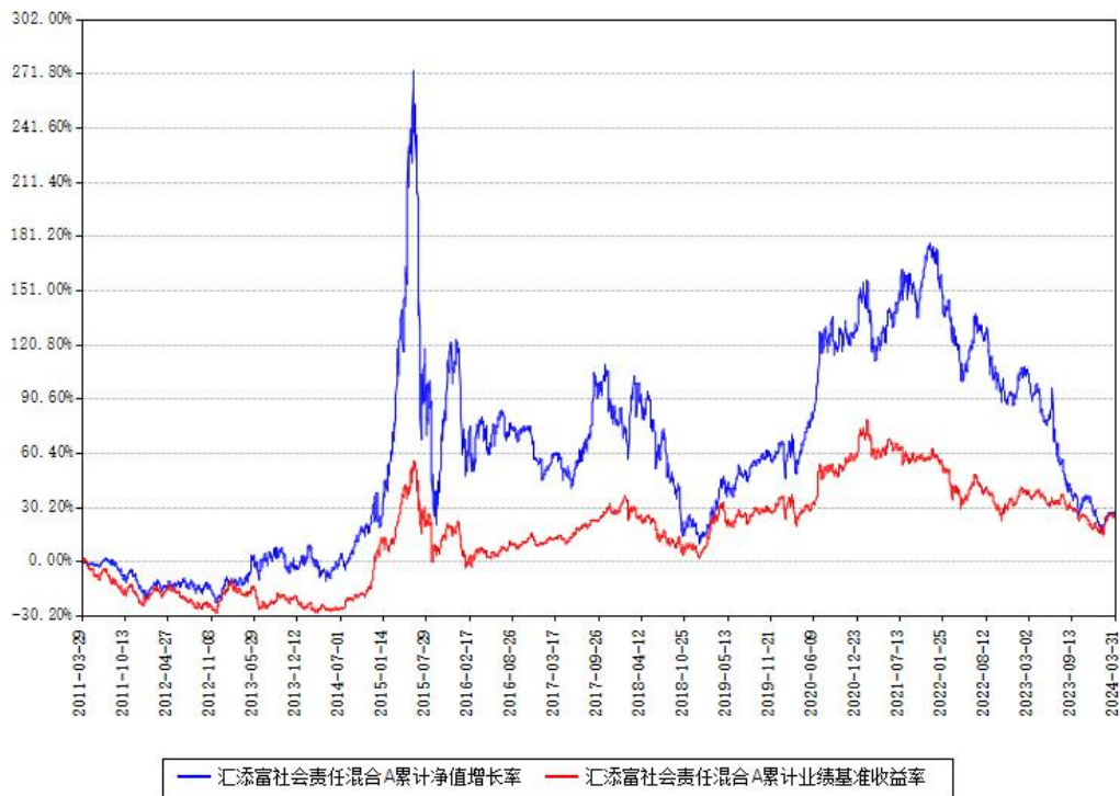
汇添富社会责任混合A累计净值增长率与同期业绩比较基准收益率对比图