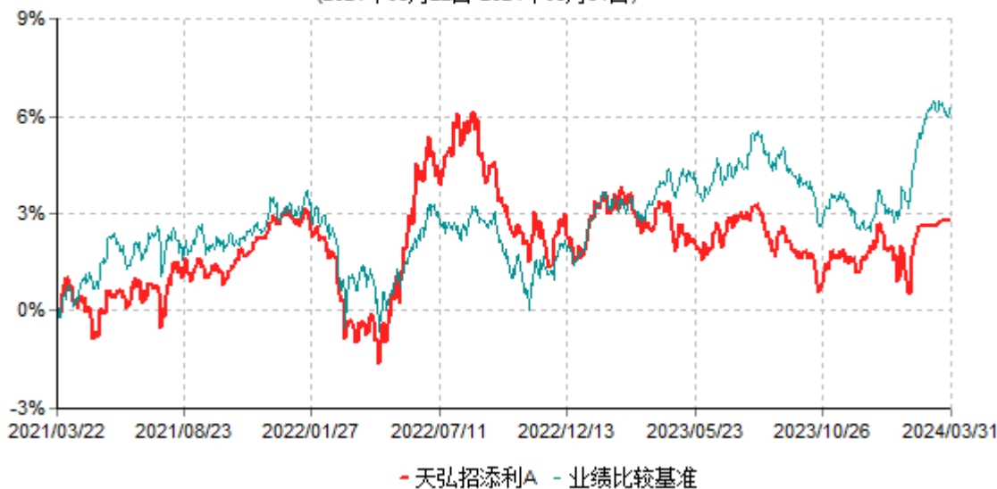
天弘招添利A累计净值增长率与业绩比较基准收益率历史走势对比图 (2021年03月22日-2024年03月31日)