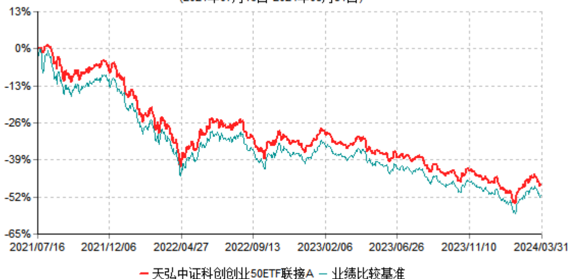
天弘中证科创创业50ETF联接A累计净值增长率与业绩比较基准收益率历史走势对比图 (2021年07月16日-2024年03月31日)