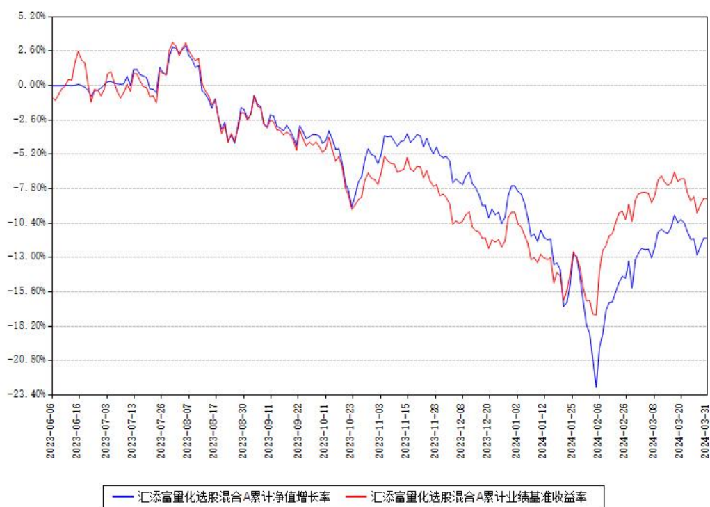
汇添富量化选股混合A累计净值增长率与同期业绩比较基准收益率对比图