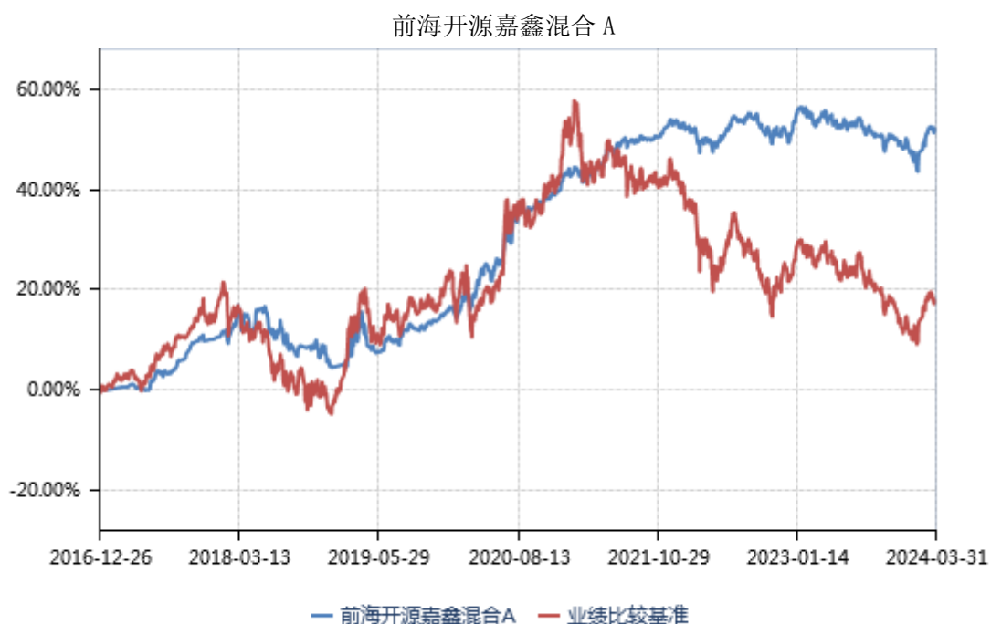
前海开源嘉鑫混合 C