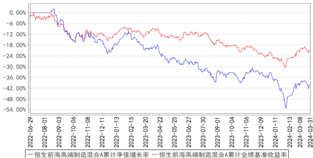
恒生前海高端制造混合A累计净值增长率与同期业绩比较基准收益率的历史走势对比图