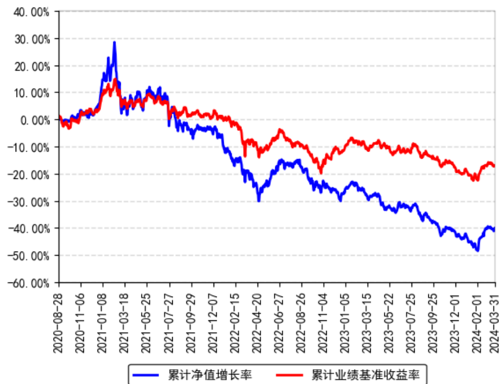
南方创新驱动混合A累计净值增长率与同期业绩比较基准收益率的历史走势对比图