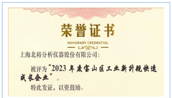
工业新升规快速成长企业荣誉