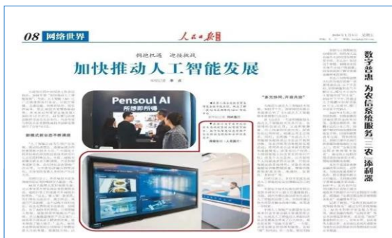
人民日报报道 AI 智慧无人分析检测系统