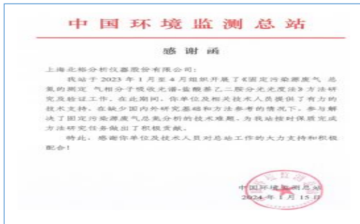
中国环境监测总站感谢信