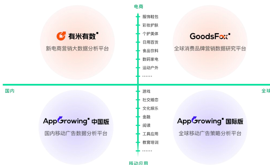
图 2 营销大数据业务有米云矩阵图

面向海外市场上线国际版产品——全球移动广告策略分析平台，为全球移动应用广告主提供全方位的市场策略洞察和精细化的广告创意分析，为移动广告从业者，特别是游戏营销人员提供本地化营销策略参考，助力营销效率的提升。