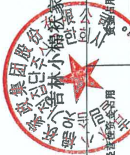
实际控制人及其关联方资金占用情况汇总表