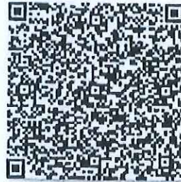
黄宗的年检二维码

本证书经检验合格，继续有效一年。 This certificate is valid for another year after this renewal.