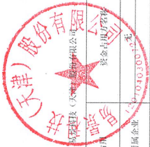
2023年度非经营性资金占用及其他关联资金往来情况汇总表