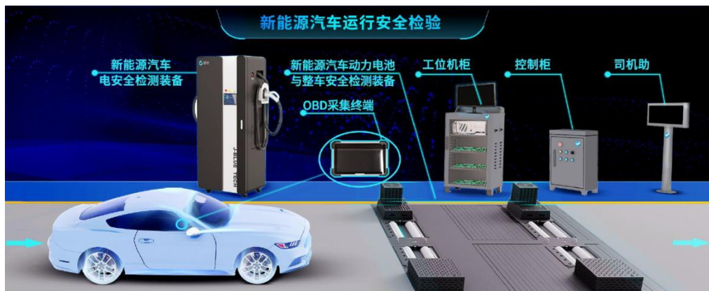
新能源汽车检验整体布局

公司联合中国汽研等头部公司，成立全国智能新能源汽车后市场行业产教融合共同体。与中国汽研达成战略合作，双方发挥各自优势，共建年检行业培训服务体系，开辟新能源汽车检验产教融合新模式。2023年在成都工业职业技术学院落地新能源汽车检验实训基地项目。