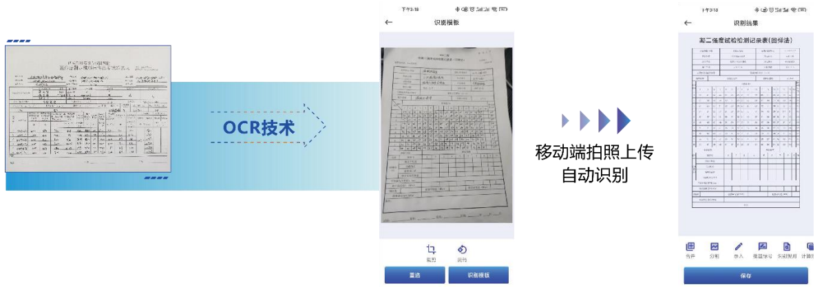
纸质表单识别技术

年研发的智慧试验与检、监测系统（STIMs），采用模块化、内核（数据、算法类）与周边（管理、流程类）分离、专业开发和用户低代码自定义混合的架构，兼顾了系统的完整性和灵活性，一经推出即引起了广泛的关注。其中，针对试验、检测行业中广泛存在的手填表格型分析项目，发明了基于 OCR 的数字化处理技术，实现了自定义、同一格式的手填、PC 端和手机端录入的自动识别和解析，可大幅提高作业效率和精度。此外，搭载的人工智能（AI）工具包在弹性波信号分析、图像识别等方面已经陆续产品化，以期推动行业的数字化升级。