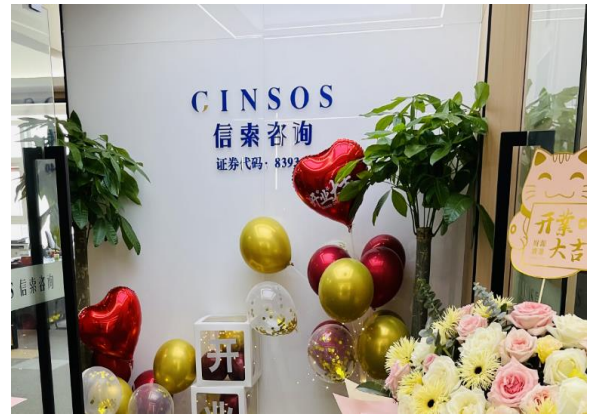
2023年6月6日，信索咨询设立长沙分公司 新办公地址位于：长沙市雨花区砂子塘街道韶山中路1 号潇影大厦2505