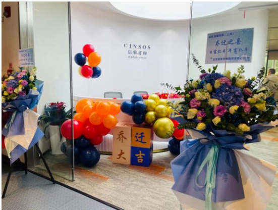
2023年12月2日，信索咨询上海分公司正式乔迁新址 新办公地址位于：上海市浦东新区世博馆路200号华能 上海大厦A201-202