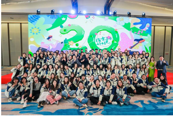
2023年4月，信索咨询公司举办了主题为“信索好时光”的周年庆典活动。