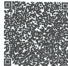
国秀琪的年检二维码

本证书经检验合格，继续有效一年。 This certificate is valid for another year after this renewal.