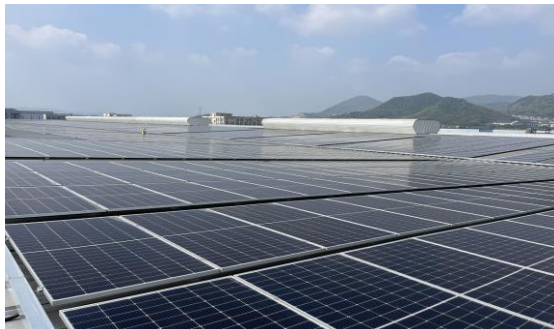
湖州新坐标光伏项目

公司重视防治“三废”污染，雨污、清污分流，生产废水经配套污水处理站处理达到三级纳管标准后纳入市政污水管网，送余杭污水处理厂处理；淬火油烟废气经油烟净化器处理后高空排放，抛丸废气经配套布袋除尘设施处理后高空排放，冷镦油烟废气经油烟净化器处理后高空排放、二期油烟废气经油烟净化器处理后高空排放；对各类机械设备及工艺段采取了隔音罩、吸音棉等降噪措施，并定期进行自我监测。公司始终严格做好环保设施的运行维护管理,做到治理设施较生产设备“先启后停”，定期检查、清理和维护，保证环保设备设施完好，运转率达到要求，并委托有资质单位定期对“三废”进行检测，确保“三废”排放符合相应排放标准。