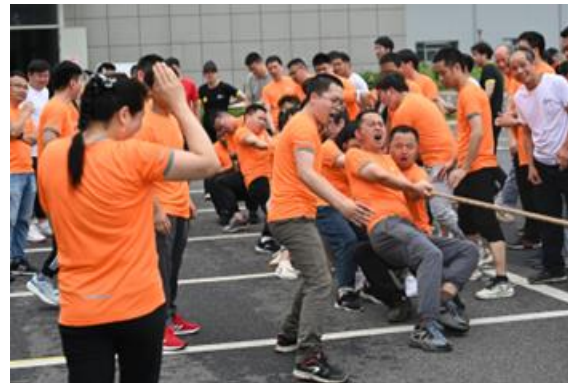
第四届“新坐标杯”运动会