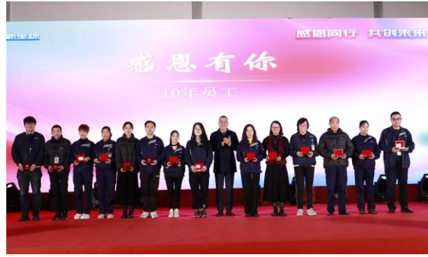
为10年员工赠送定制金钞

公司鼓励员工积极参加锻炼，倡导“健康生活，快乐工作”理念，号召全体员工健康生活，始于足下。公司为员工提供了良好的运动场地，包括篮球场、羽毛球场、乒乓球桌，每年组织运动会。为丰富员工生活，放松心情，增强员工团队意识及归属感，公司给予每位员工活动经费开展团队活动。