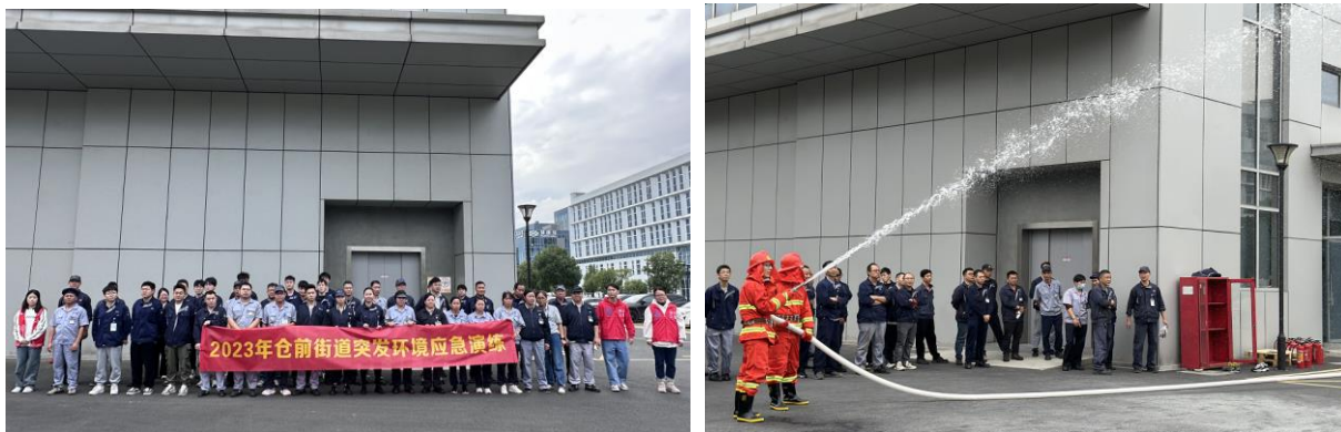
2023 年度消防、环境突发事件演习

传教育，以提高员工的安全意识和应急处置能力。同时督促员工严格执行公司的安全生产规章制度和安全操作规程。