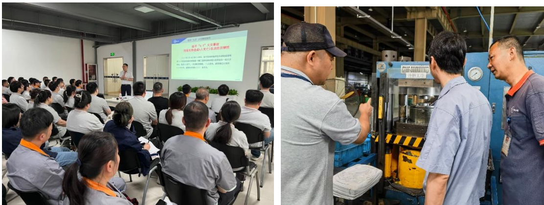
2023 年安全生产月培训、安全隐患排查