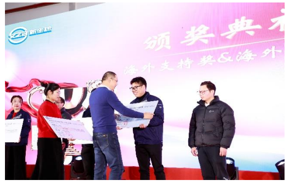
2023 年度优秀评选颁奖