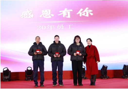
为20年员工赠送定制金条