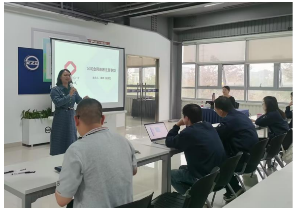
公司合同签署培训