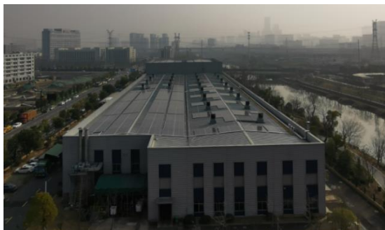
永乐一期光伏项目

2023 年，公司响应国家关于做好科技支撑碳达峰、碳中和的工作政策。报告期内，使用杭州新坐标永乐一期、湖州新坐标屋顶光伏发电项目。2023 年度总计发电 3,641,107KWH，减少碳排放 3,630 吨。