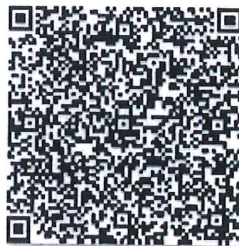
变更生的年检二维码

本证书经检验合格，继续有效一年。 This certificate is valid for another year after this renewal.