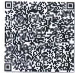
变更生的年检二维码

本证书经检验合格，继续有效一年。 This certificate is valid for another year after this renewal.