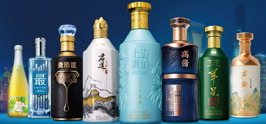
上海贵酒“多品牌、多香型”产品矩阵