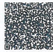
贺杨的年检二维码.qr