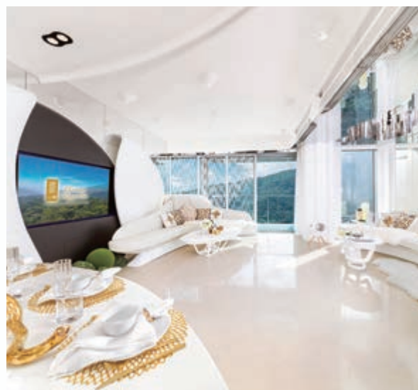
公寓單位之客廳及飯廳