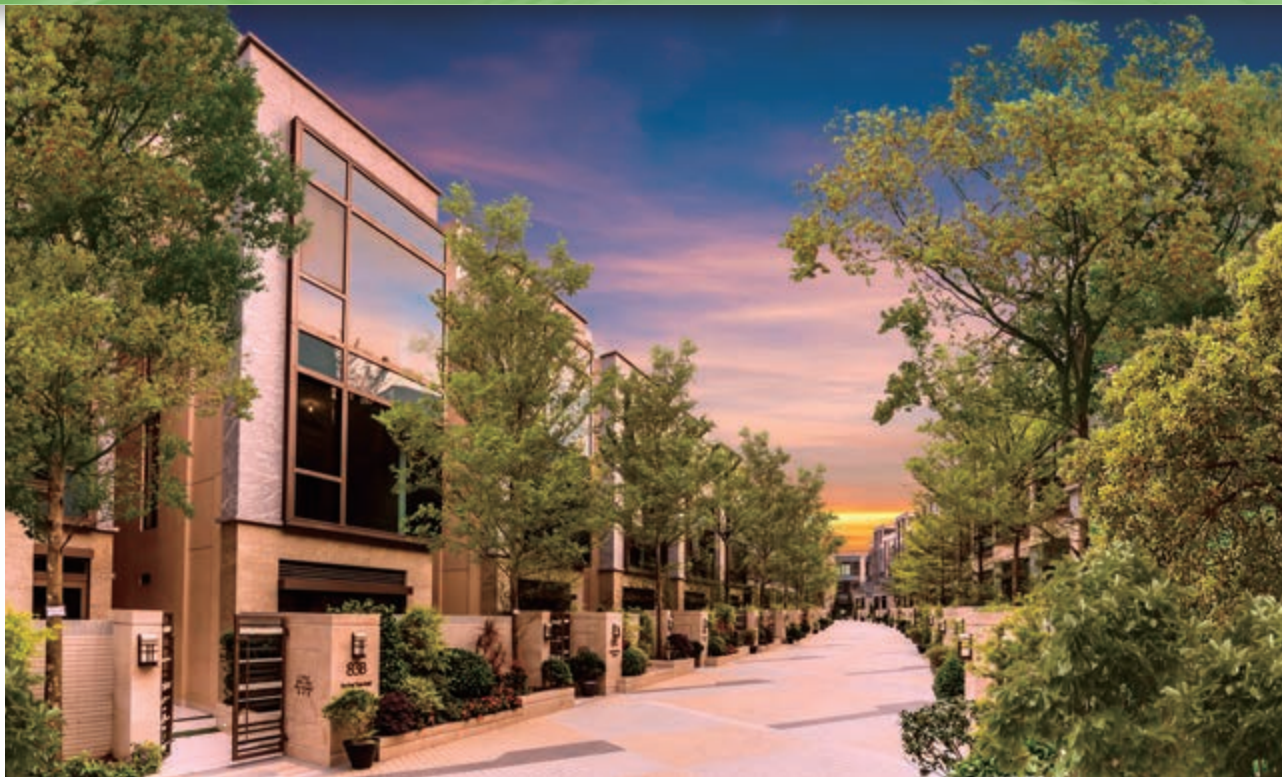
富豪 • 悦庭 — 位於新界元朗丹桂村路65至89號之住宅發展項目之花園洋房