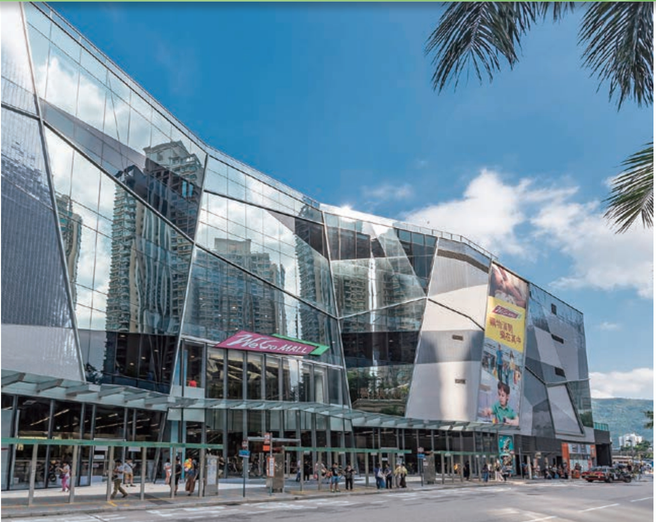
We Go MALL — 位於新界沙田馬鞍山保泰街16號之購物商場