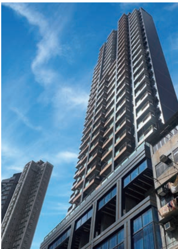
已於二零二二年八月竣工