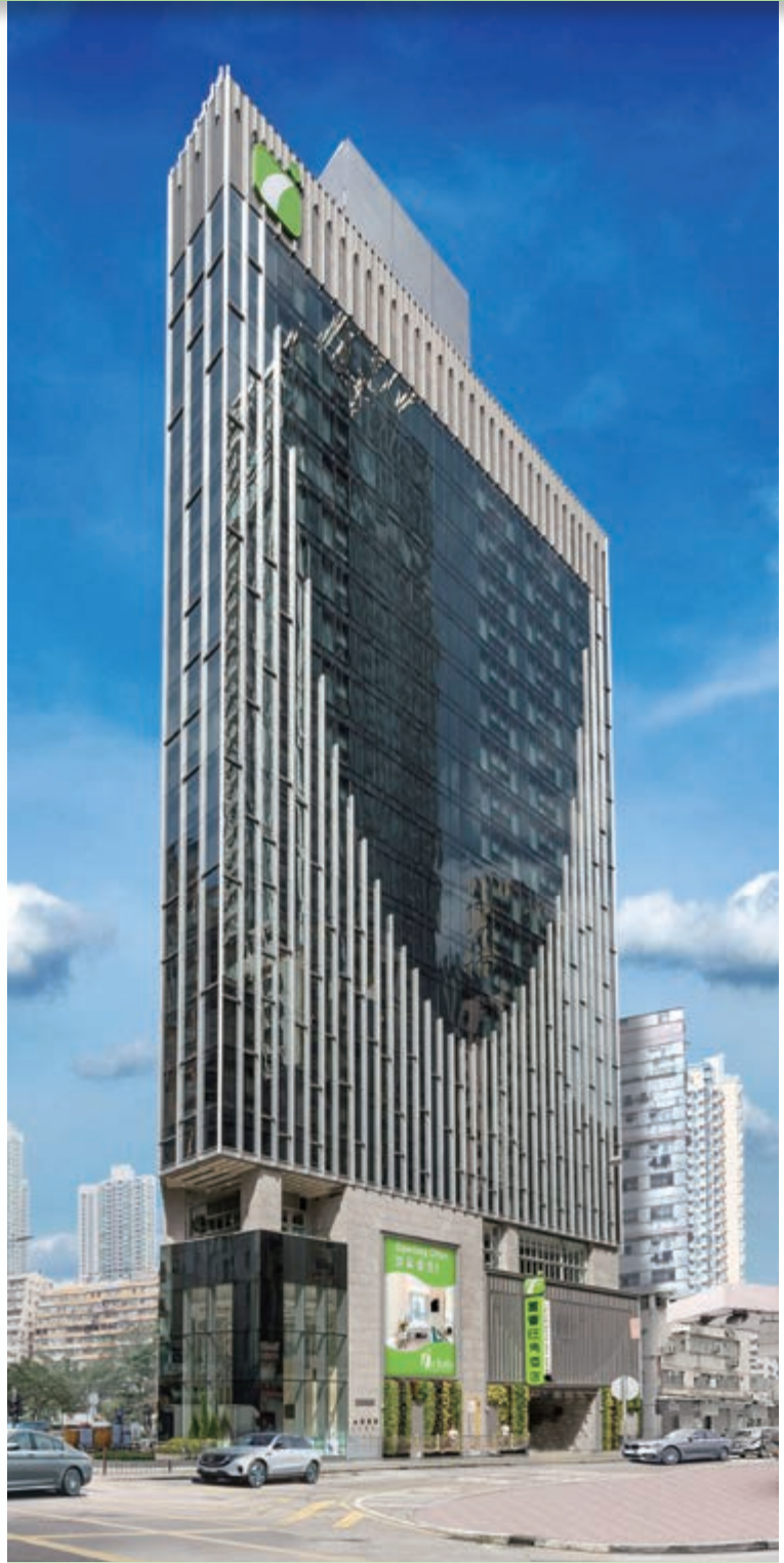
富薈旺角酒店 — 位於香港九龍旺角晏架街2號