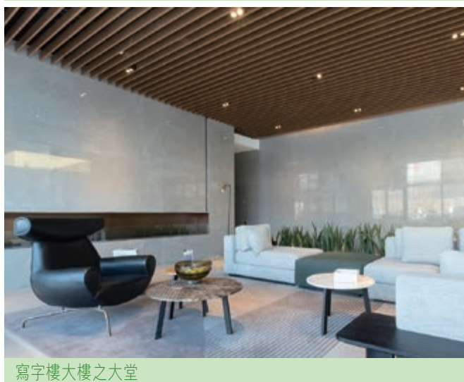
寫字樓大樓之大堂