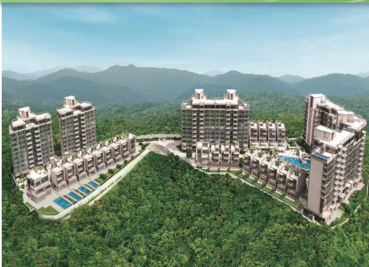
富豪 • 山峯 — 位於新界沙田九肚麗坪路23號之豪華住宅發展項目