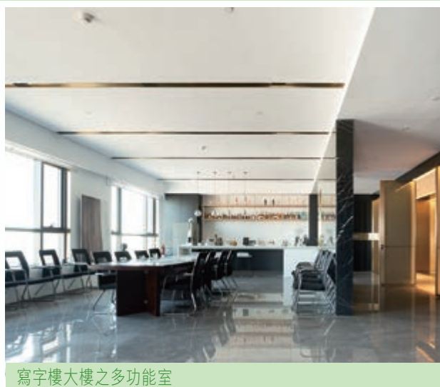
寫字樓大樓之多功能室