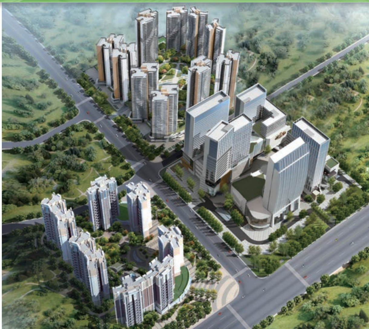
富豪國際新都薈 — 位於四川成都新都區之住宅/商業/寫字樓/酒店綜合發展項目(*)