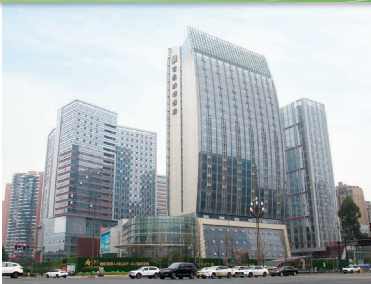
富豪國際新都薈 – 富豪新都酒店及商業/寫字樓大樓