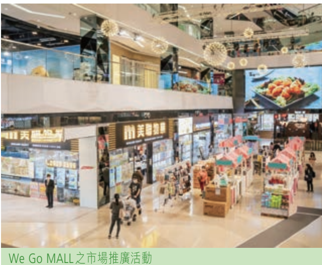
We Go MALL之市場推廣活動