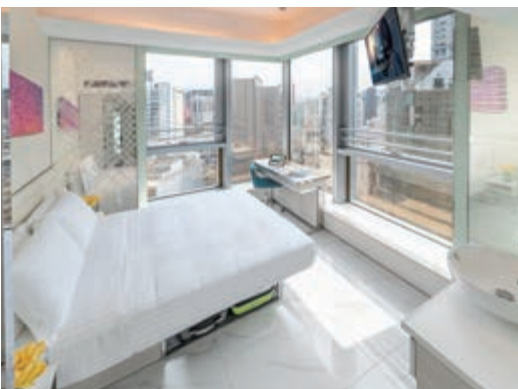
尊薈 Premier 客房