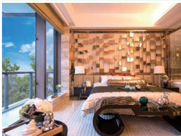
花園洋房之主人房