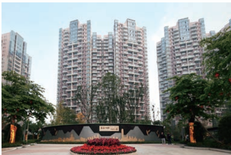
富豪國際新都薈富豪公館(第一期及第二期) — 已落成