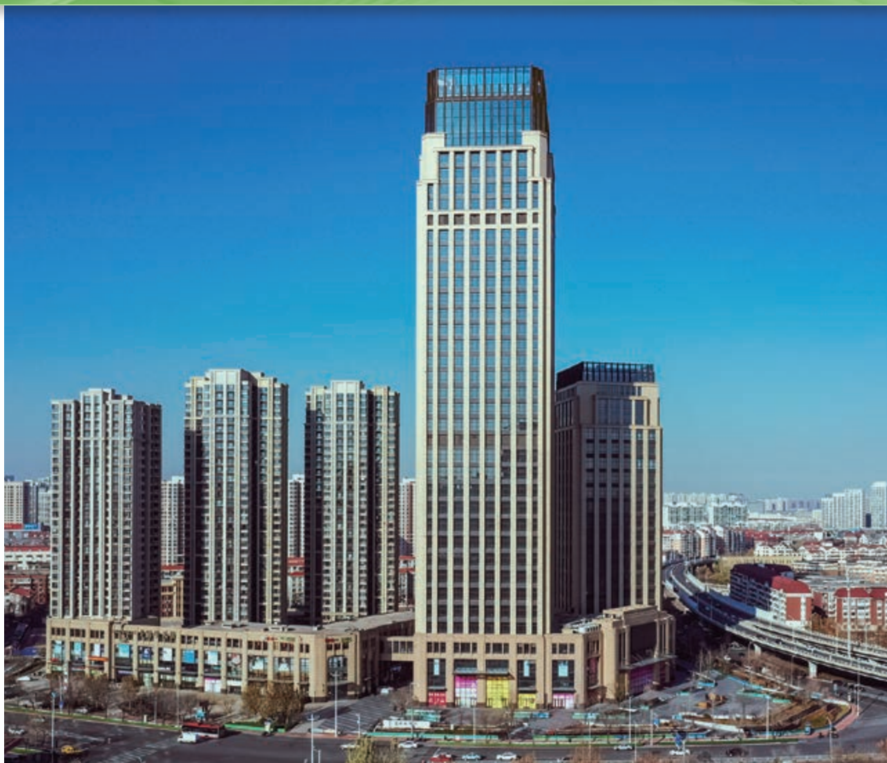
富豪新開門 — 位於天津河東區黃金地段之商業/寫字樓/住宅綜合發展項目