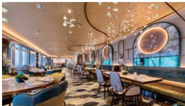
中餐廳 — 玉