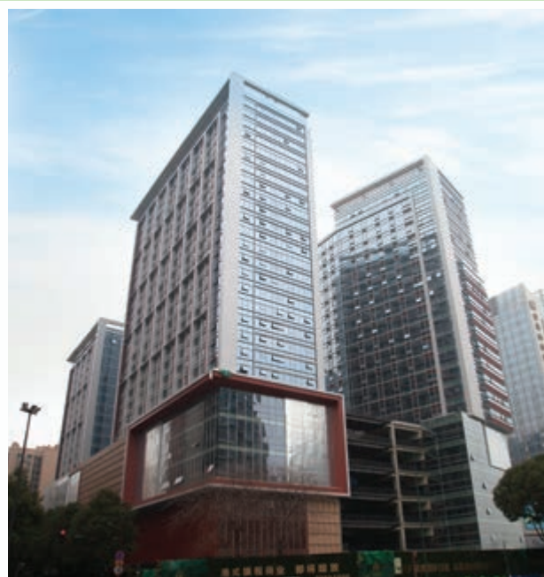
富豪新都酒店及商業/寫字樓大樓 – 建築及外牆工程已竣工