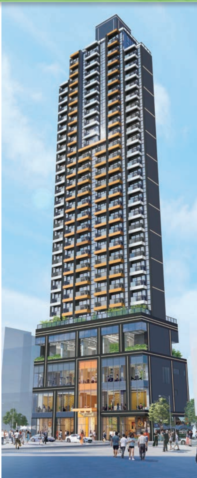
尚瓏(*) - 位於香港皇后大道西160號商業/住宅發展項目