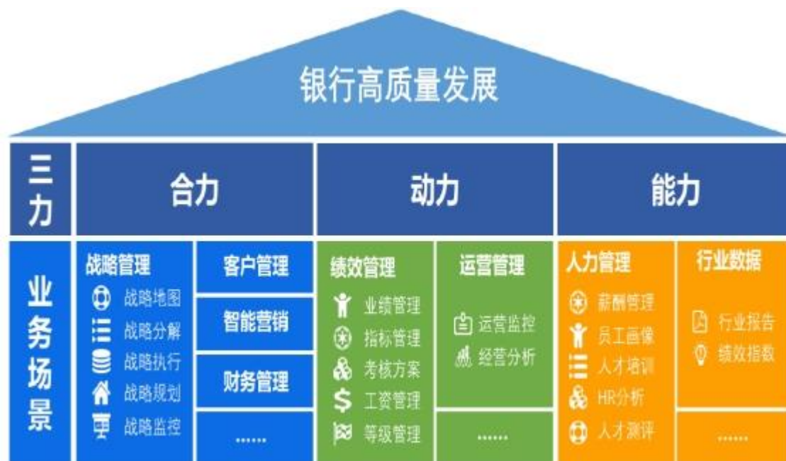
图 6:三力模型应用场景

2、应用层面，构建一站式高绩效平台的场景应用。通过打造“合力、动力、能力”三力模型应用场景，循序渐进，实现绩效管理自动化、提升员工积极性、促进银行业务发展等三层效果。