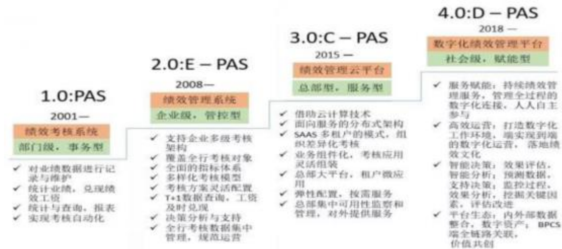
图 2 绩效管理发展历程

绩效管理数字化经历了一个持续迭代、不断进化的转型过程，完成从 1.0: PAS→2.0: E-PAS→3.0: C-PAS→4.0: D-PAS 的转变，从而实现银行绩效管理数字化的转型和升级。