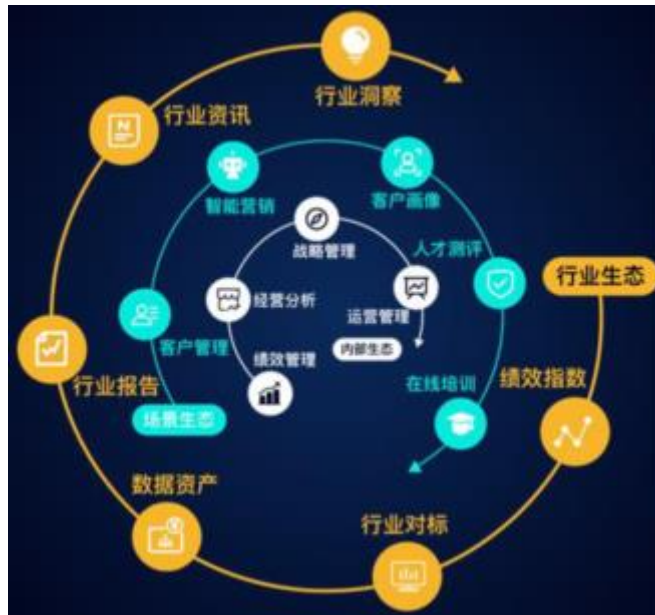
图 7：高绩效平台生态圈

天维信息致力于运用最先进的技术不断提升金融行业的运营效率。未来，天维信息与客户的合作将更深入与更多维，以科技力量打造现代化的高绩效工作平台，为金融机构打造包容开放、生机勃勃、健康良性的互联网金融生态，贡献自己的力量。