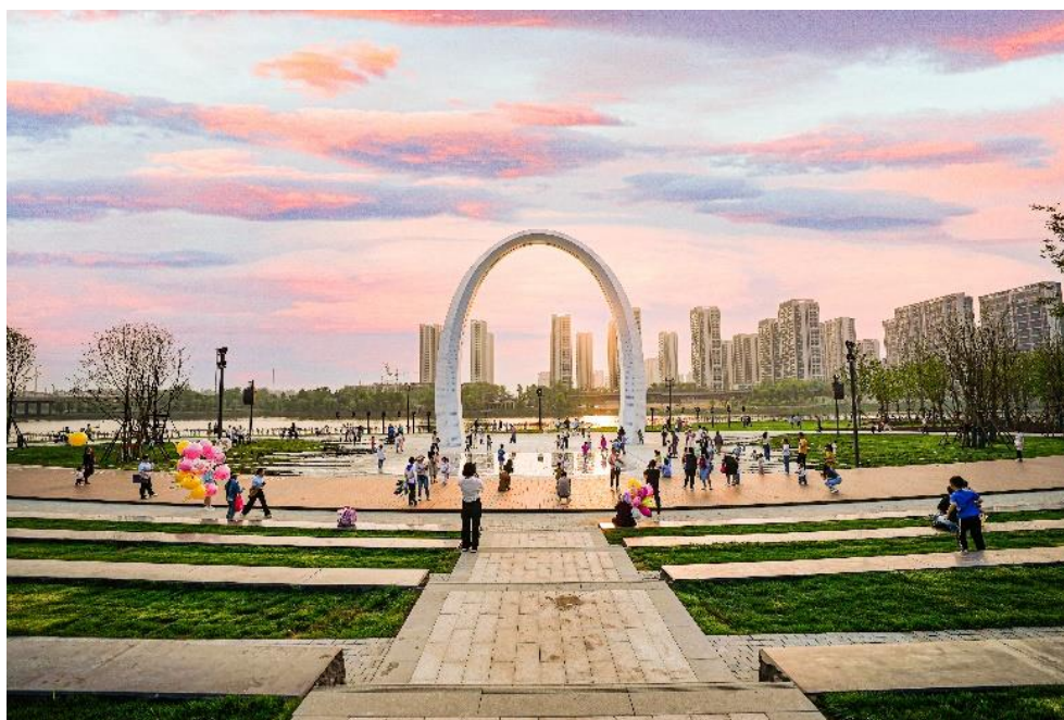
（图：信阳市潢川县光州公园项目）

对于施工总承包项目，公司实行工程项目全生命周期的成本控制。施工前，公司与客户进行沟通，了解项目的实际情况和需求，根据客户的要求和实际情况，制定施工方案和管理计划，并进行成本预测，确认计划成本。施工过程中，公司派遣专业的技术团队进行现场管理和监督，合理安排各专业施工工序，避免交叉施工产生成本浪费。项目完工后，公司及时协调客户进行竣工验收，加快推进项目进入养护期，以有效控制养护成本。同时公司采取措施加快推进结算工作，加速剩余资金回笼，保证项目现金流，减少资金成本。