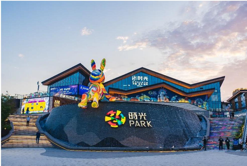
(图：江西上饶时光 park 项目)