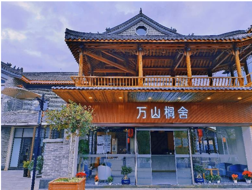
(图：万山桐舍精品民宿)