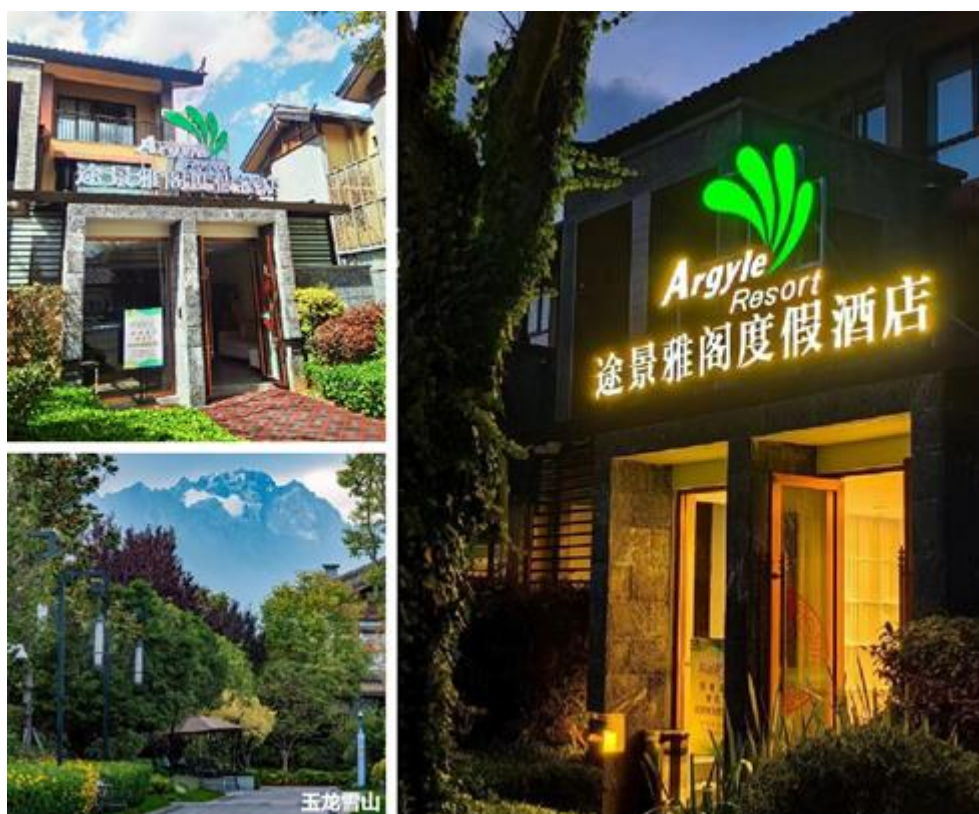
(图：途景雅阁度假酒店)