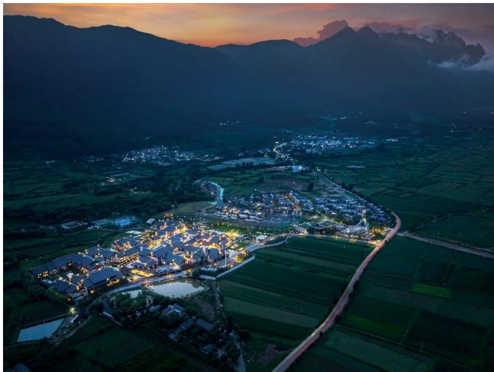
（图：丽江市 Club Med 国际度假酒店项目）