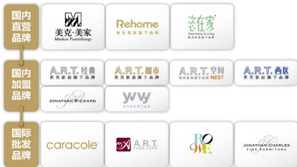
自营渠道品牌矩阵图

本公司主要从事家具及配套家居产品的生产及销售，是集多品牌、多渠道于一体的国际综合家居消费品公司，证监会行业分类“批发与零售业-零售业”。公司主营家居产品的国内零售和国际品牌批发业务，旗下品牌产品覆盖实木成品家具、沙发、家居饰品、睡眠用品、定制柜类等，客户覆盖追求生活品味和艺术的新中产及多元化客户群体，提供高品位、风格差异化及价格带丰富的集整案设计、软装设计服务、成品及定制家居产品及送货安装等于一体的整装全案解决方案，满足客户“一站式置家”需求。同时，公司还拥有规模化制造基地，被工信部认证的“智能车间试点示范”项目，高效的管理平台，以国家级工业设计中心为核心的研发机构，及覆盖全球的销售网络。具备从产品设计、开发、生产、销售、服务的端到端垂直一体化价值链。