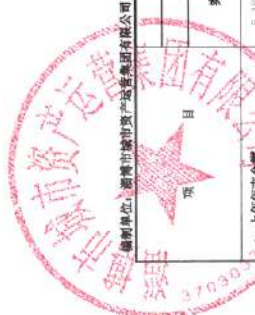
合并所有者权益变动表（续） 2023年度