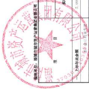
所有者权益变动表 2023年度