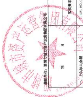
合并所有者权益变动表 2023年度