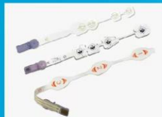
一次性无创脑电传感器