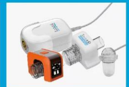
呼吸末设备、传感器