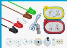
心电电极及导联线