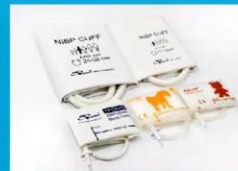
新生儿一次性袖带