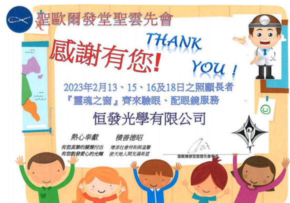
來自聖歐爾發堂的感謝狀