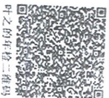
叶之的年检二维码

本证书经检验合格，继续有效一年。 This certificate is valid for another year after this renewal.