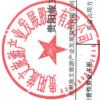
贵阳文化旅游产业股份有限公司2023年度非经营性资金占用及其他关联资金往来情况汇总表