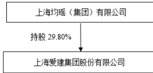
公司与控股股东股权关系方框图