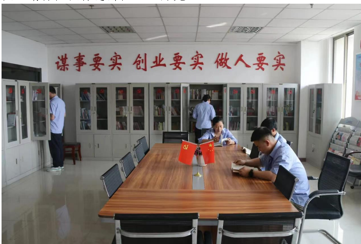
图11子公司神剑科技职工书屋

工书屋，购买了一批党建、经营管理、法律法规等专业书籍，推进全民阅读，满足职工多样化阅读需求。神剑公司开展职工书屋建设活动，投入资金1.5万元，采购图书260册、215种。东风公司开展困难员工摸底排查，持续更新、完善80余户困难职工档案。红星公司开展夏日“送清凉”活动，发放风油精、花露水、矿泉水等物品共计3.6万元。方圆公司为职工购买互助保险团体意外险3.61万元。