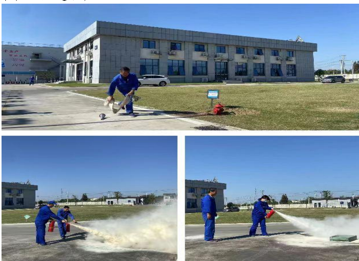
图7子公司红星机电公司开展消防安全月专项行动

3. 全面有序推动“安全生产月”活动，打好“组合拳”，开展了“六六六”行动（“六大专题”“六个重点”和“六项活动”），以及“进车间、进班组、进靶场、进库区、进租户”五进活动。