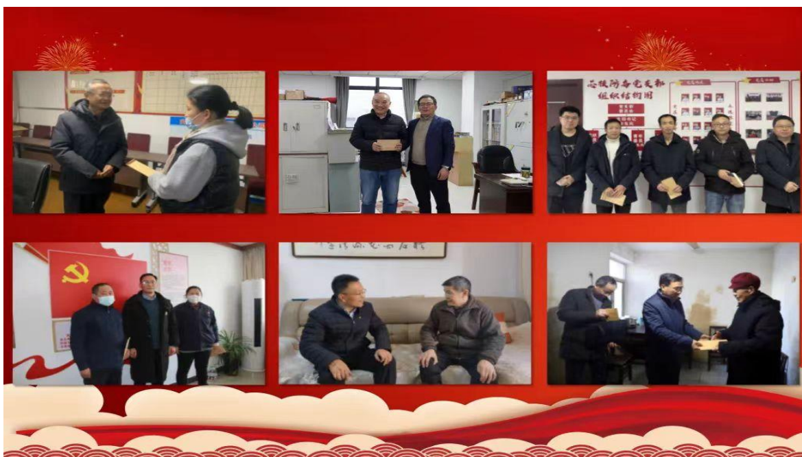
图9长城军工开展春节暖心慰问活动