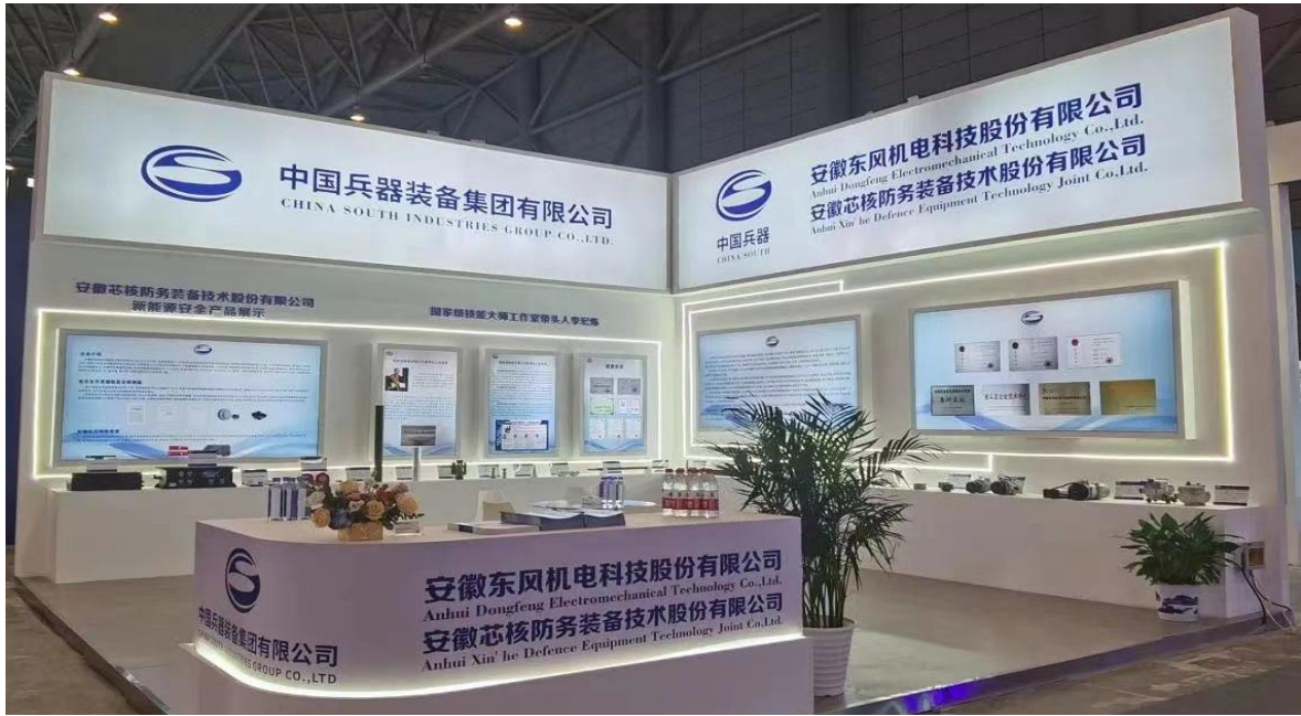
图16子公司东风机电亮相2023世界制造业大会