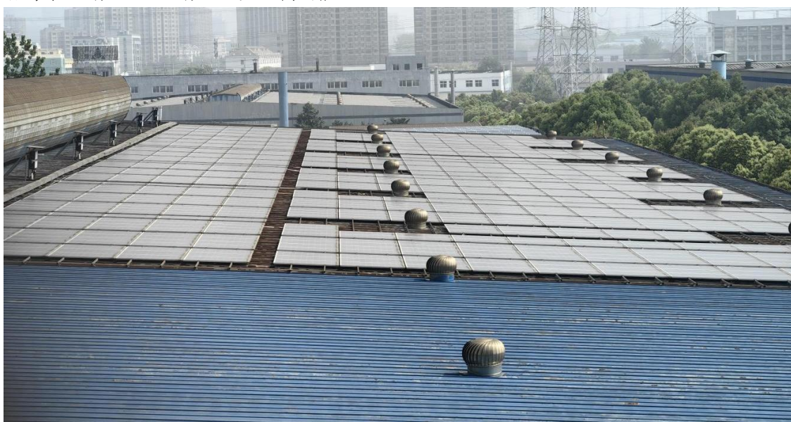
图6子公司神剑科技利用工房房顶闲置资源建设光伏发电系统

下属子公司建有工业废水处理站、酸雾处理设施、有机废气处理设施及其他除尘设施，均安装污染源在线监控设备。对污染源在线监测制定管理流程，明确管理责任，设专职管理人员，负责对数据进行实时监控管理，通过有序、规范的日常管理工作，目前各处理设施正常运行，具有足够的处理能力，废水、废气达标排放。