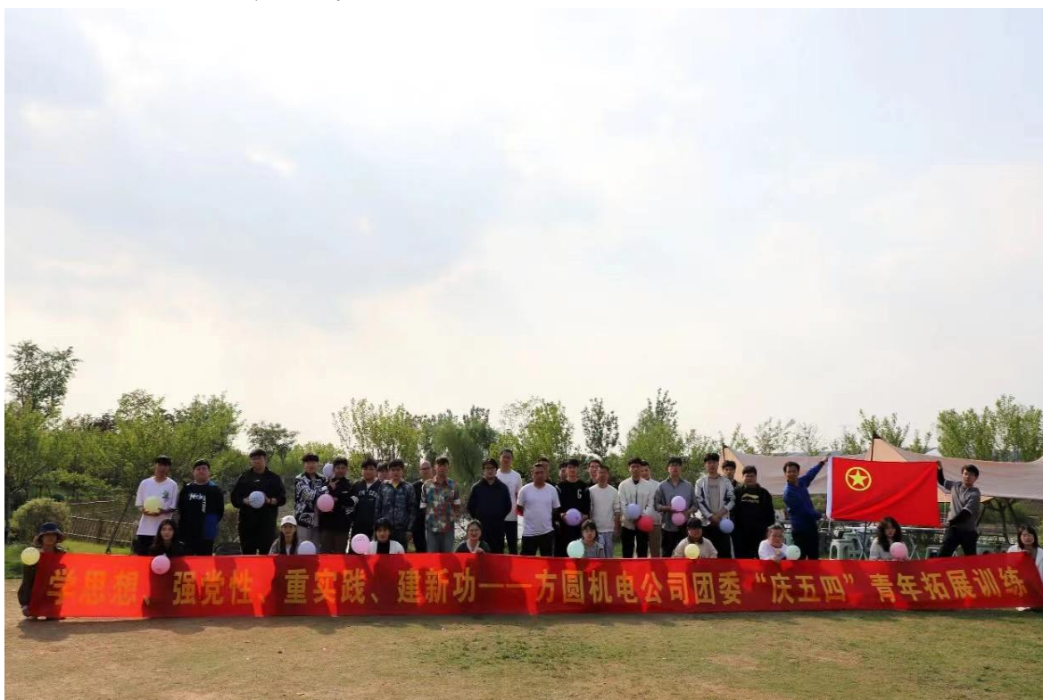
图3子公司方圆机电公司团委开展五四青年拓展训练活动

公司为增强员工团队凝聚力、促进员工之间的交流与合作，建立积极的工作环境与文化，提高员工的归属感与满意度，积极组织新员工入职培训、户外拓展训练、社会公益活动、主题晚会等团建活动。