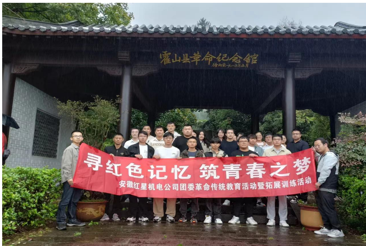
图12子公司红星机电开展“革命传统教育活动及拓展训练活动”

女职工登山活动等;红星公司组织女职工参加省国防邮电工会“玫瑰书香·书润匠心”读书征文活动,获得优秀组织单位称号;方圆公司组织团员青年赴革命老区霍山,开展祭奠革命先烈暨革命传统教育,传承红色基因,赓续军工优良传统。通过开展丰富多样的文体活动,增强了职工群众的归属感与幸福感,形成了积极向上、团结友爱的良好发展氛围。