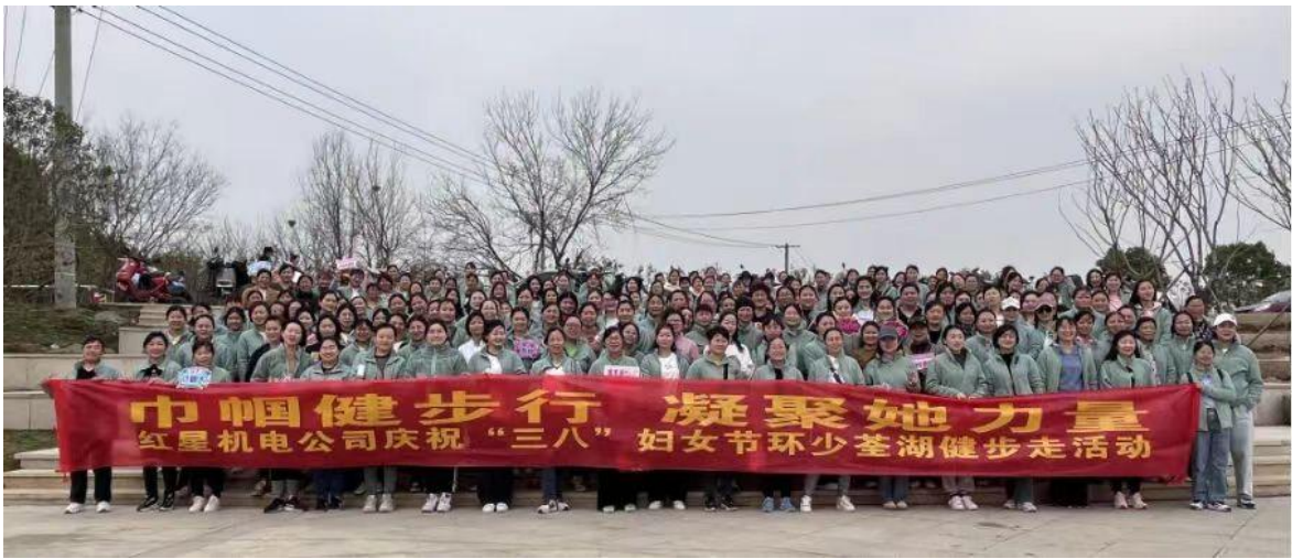
图13子公司红星机电公司女工委开展少荃湖畔毅行活动

报道，弘扬女职工先进事迹。关心关爱患病女职工、单亲母亲等特殊群体，发放慰问金4.74万元，惠及79位困难女职工。