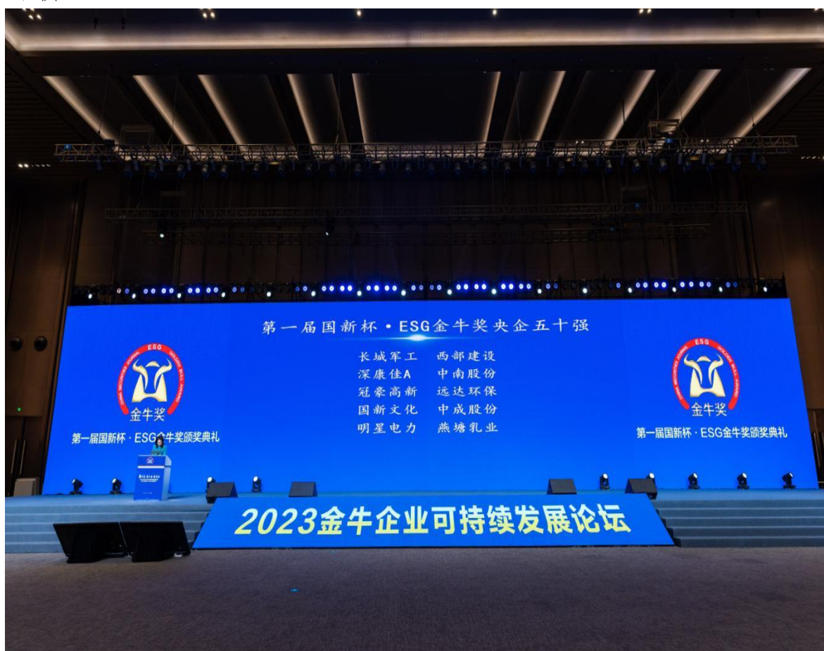
图2长城军工荣获第一届国新杯ESG金牛奖央企五十强

2023年，公司严格落实信息披露制度，持续完善信息披露工作机制，认真履行信息披露义务，及时、公平地披露了公司信息，披露的信息真实、准确、完整，简明清晰、通俗易懂。报告期内，完成200余项上网公告及附件信息披露工作，有效提升了公司对外披露信息的质量和透明度，确保了广大投资者利益。2023年，公司信息披露工作再次获得上交所A级评价。