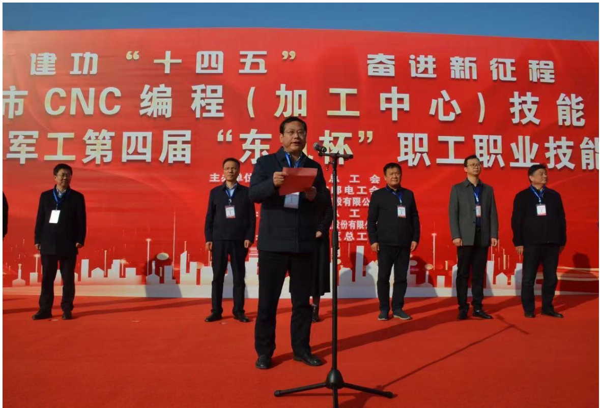
图14子公司东风机电成功举办第四届“东风杯”职工职业技能