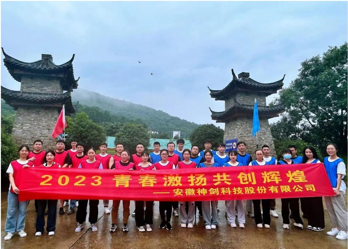
图4子公司神剑科技公司组织新职工开展入职培训