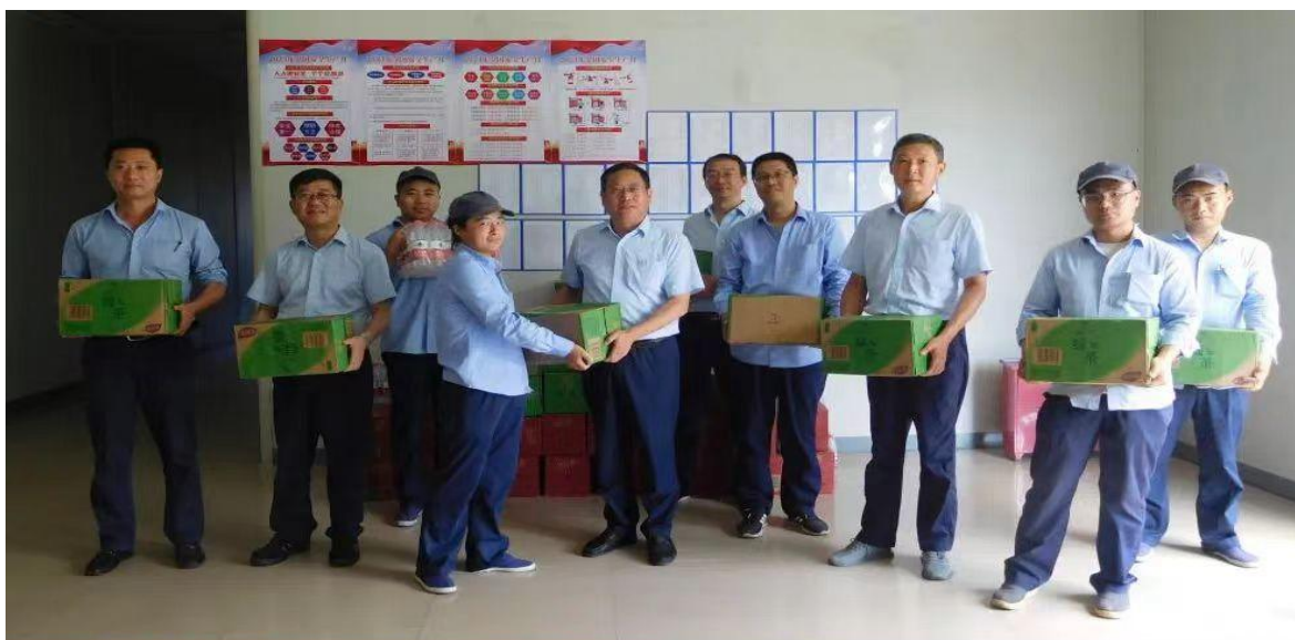
图10子公司东风机电公司开展送清凉活动