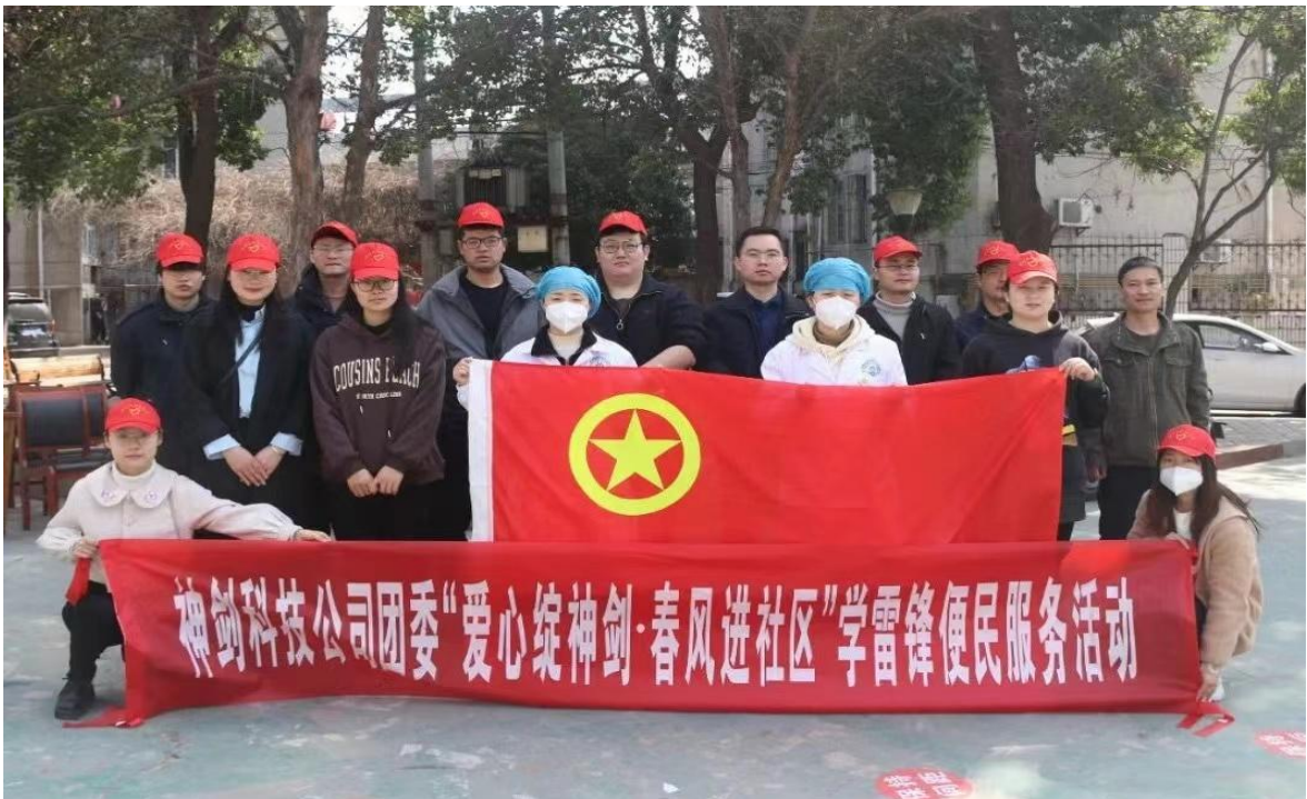
图5子公司神剑科技组织开展“爱心绽神剑 春风进社区”学雷锋便民志愿服务活动