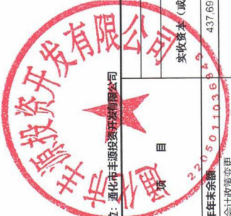
合并股东权益变动表 (续) 2023年度