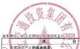
合并现金流量表 2023年度