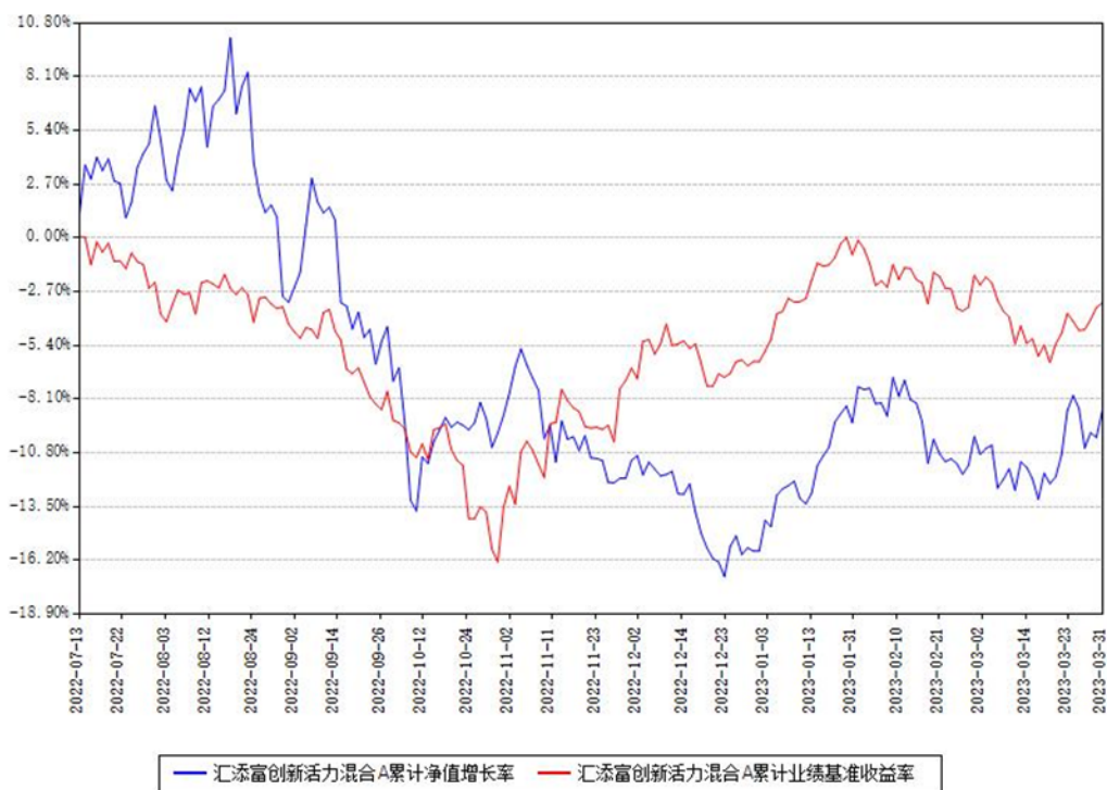
汇添富创新活力混合A累计净值增长率与同期业绩基准收益率对比图

(二) 自基金合同生效以来基金累计净值增长率变动及其与同期业绩比较基准收益率变动的比较图