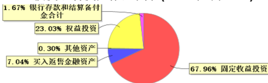
投资组合资产配置图表(2024年3月31日)

● 固定收益投资 ● 买入返售金融资产 ● 其他资产 ● 权益投资 ● 银行存款和结算备付金合计