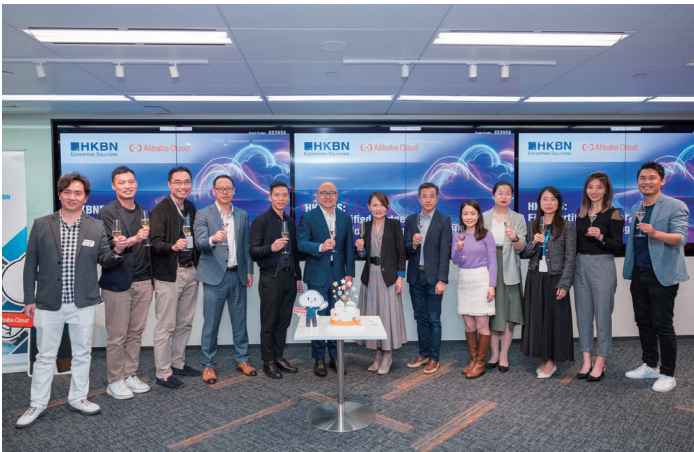
香港寬頻企業方案團隊憑藉多雲系統整合方面的卓越實力，成為香港首家獲認證的阿里雲 Landing Zone 合作夥伴。

香港寬頻企業方案將支援阿里雲 Landing Zone 雲端管理框架下的多個關鍵範疇，包括資源管理、營運及維修、合規及審計、自動化、安全防護、財務管理、網絡規劃及賬戶權限管理。透過上述方案，我們將協助企業客戶有效地設計及管理雲端上的IT環境。