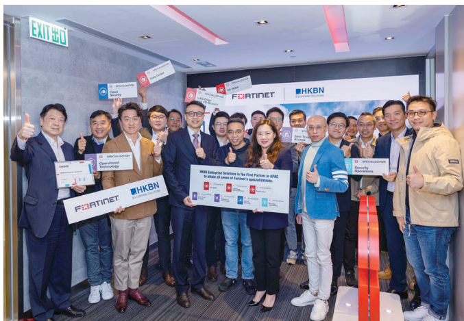
香港寬頻於亞洲再創第一。

Fortinet Engage計劃助合作夥伴成為值得信賴的顧問。作為合作夥伴之一，我們具備領先的專業知識、服務和技術，以滿足其客戶在數碼轉型方面的需求。此全面的計劃包括七個專業認證，涵蓋了現今急速發展、需求高的網絡安全領域，包括SD-WAN、LAN Edge及SD Branch、數據中心、雲安全、零信任網絡訪問、運營技術和安全運營。