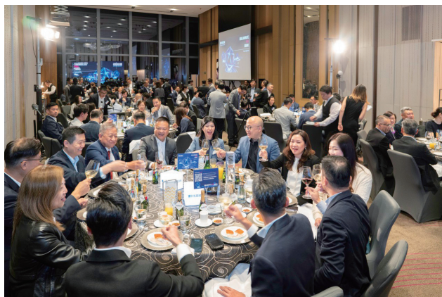
當人才聚首一堂，便會擦出火花。一眾香港寬頻企業方案的管理層與高級領袖，主辦香港寬頻企業方案週年合作夥伴晚宴2023。