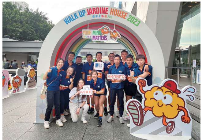
我們在思健香港舉辦的「齊步上怡廈—實體賽」中大顯身手。我們的精英運動員團隊跑上怡和大廈共49層947級，並在虛擬賽中獲得勝利。

今年，香港寬頻熱情參與齊步上怡廈，這個獨特的混合挑戰活動透過結合實體與虛擬體驗吸引參與者。我們展現出積極的態度與強大的團隊精神，在虛擬賽中獲得全港公司中總成績第一名。香港寬頻人才於放置在各個辦公室的健身踏步機上，在兩週內合共踏上835,243步，達到驕人佳績。