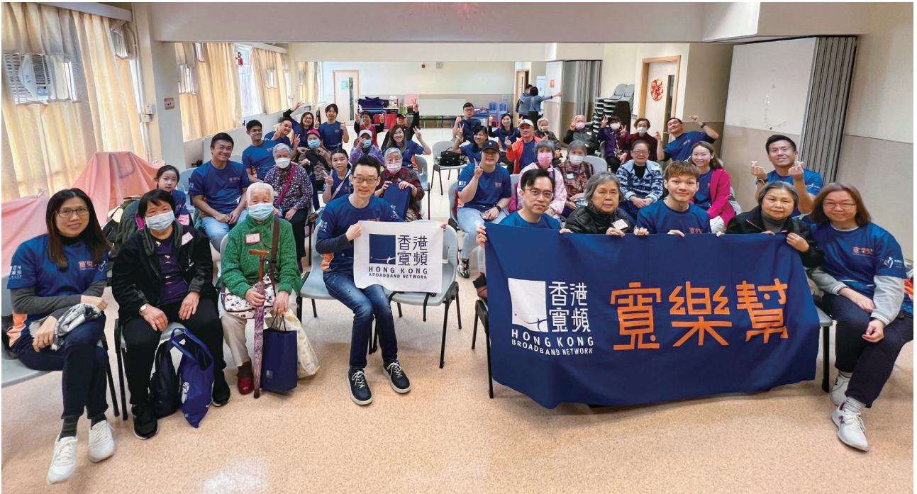
傳播微笑與專業知識：農曆新年期間，我們在明愛牛頭角社區中心舉辦暖心的長者探訪活動，義工帶來喜悅、歡笑及許多網絡安全貼士。

2024年2月，我們舉辦了一項有意義的義工活動，為長者社區提供安全參與數碼世界的基本知識。參與者表示，這項活動加深了如何保護個人資料安全的認識，這一正面成果證明了我們推動數碼共融，讓社區人士更安全地使用社交媒體及技術方面所作出的努力。