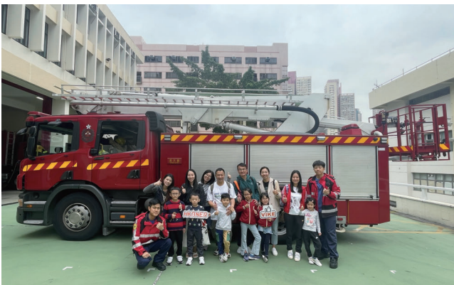
啟發未來英雄！我們的Smart Working Parents Club為人才與他們的子女在香港消防局展開一天探索之旅。