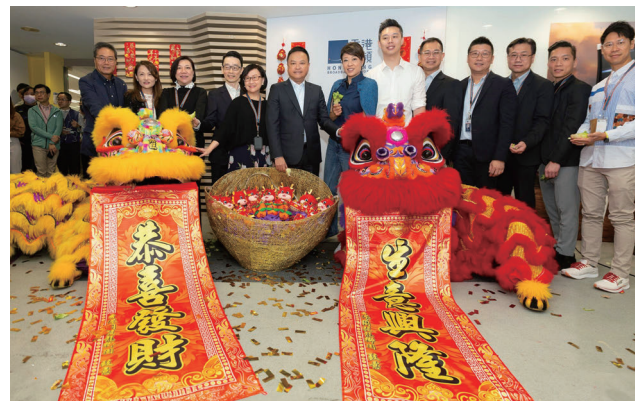
我們以傳統舞獅表演，為香港寬頻與人才帶來好運和樂趣。