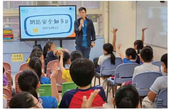
香港寬頻義工向孩子們宣揚網絡安全意識，為數碼保安作好準備。

香港寬頻的寬樂幫義工與香港小童群益會合作，為青少年會員舉辦兩場講座。這些互動環節旨在提高青少年的網絡安全意識，特別聚焦於社交媒體知識以及人工智能深度偽造技術及欺詐相關風險。