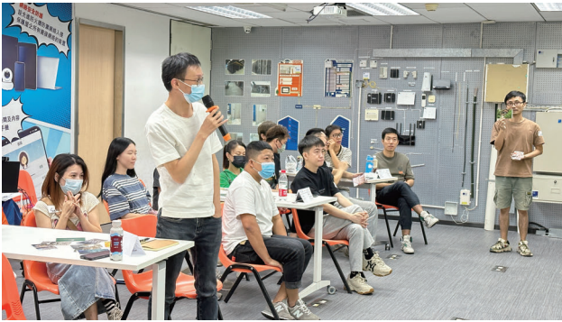
釋放潛力：全年培訓幫助我們的人才提升技能、知識和最佳實踐。