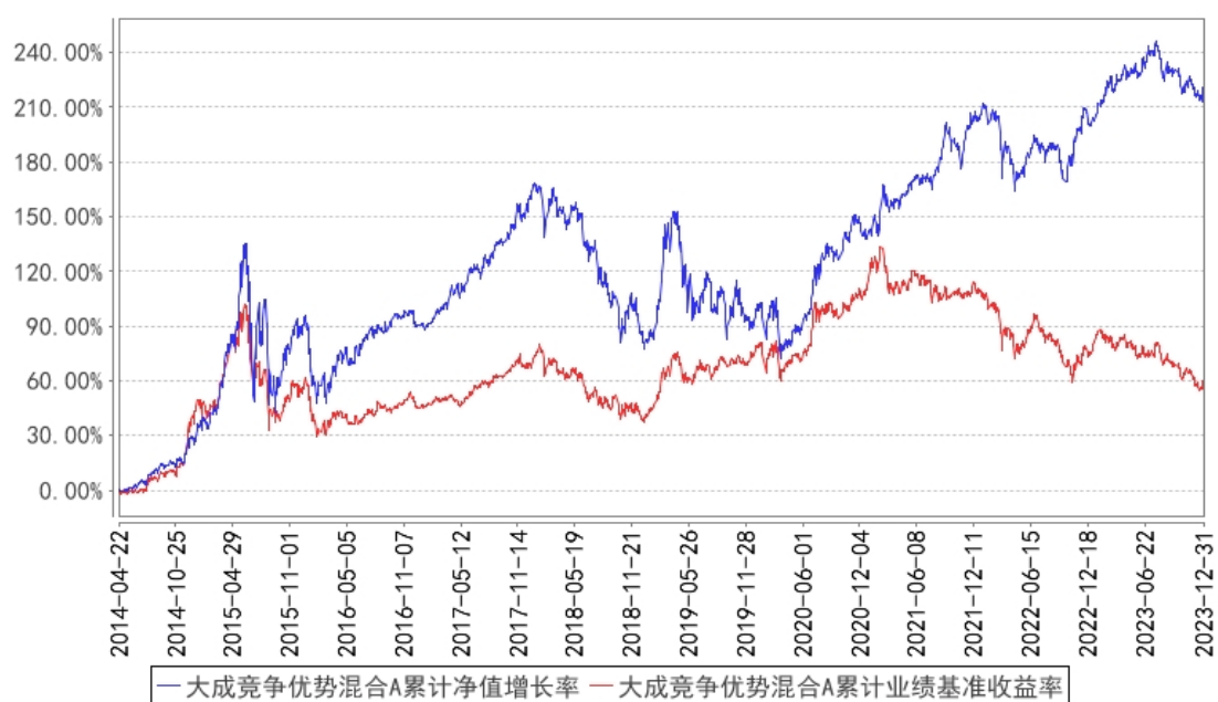
大成竞争优势混合A累计净值增长率与同期业绩比较基准收益率的历史走势对比图

(二)自基金合同生效以来基金份额累计净值增长率变动及其与同期业绩比较基准收益率变动的比较