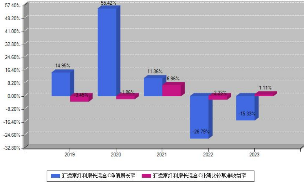
汇添富红利增长混合C每年净值增长率与同期业绩基准收益率对比图

注：数据截止日期为2023年12月31日，基金的过往业绩不代表未来表现。本《基金合同》生效之日为2019年04月26日，合同生效当年按实际存续期计算，不按整个自然年度进行折算。